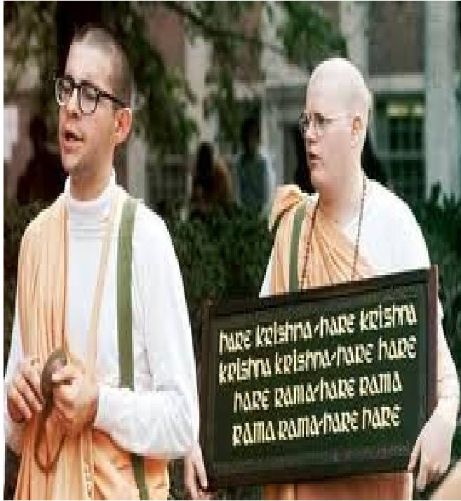
5.- hare krishna